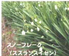
スノーフレーク (ススランスイセン)