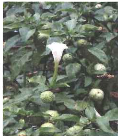
チョウセンアサガオの葉と花