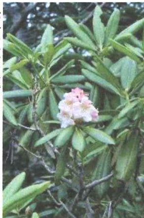
ハクサンシャクナゲ