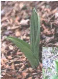
芽出し期のバイケイソウ