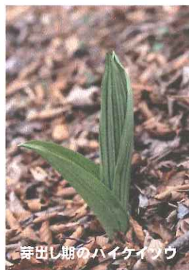
芽出し期のバイケイソウ