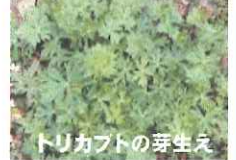
トリカブトの芽生え