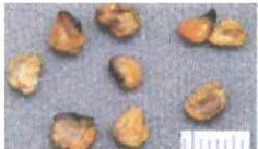
チョウセンアサガオの種