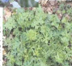
トリカブトの芽生え