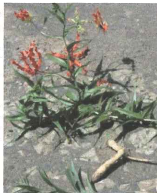
地下部を付けたグロリオサ全体